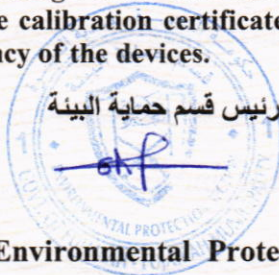
رئيس قسم حماية البيئة Head of Environmental Protection Section